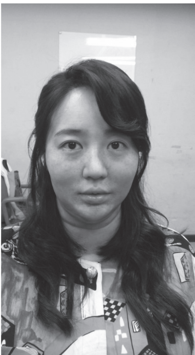
▲ 셀의 특수분장을 받은 '오마이비너스' 때의 배우 신민아(왼쪽), '허삼관' 때의 배우 윤은혜(오른쪽)