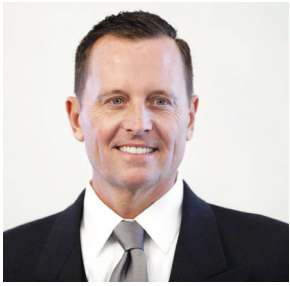
리처드 그레넬 前 주독일 미국대사(사진), 인터뷰서 밝혀 "미국 납세자들은 다른 나라 위해 너무 많은 돈 지불하는 것 반대"

미국의 전직 고위 외교관이자 트럼프 대통령의 측근이 '트럼프 대통령이 한국에서 주한미군을 철수하려는 계획을 가지고 있다'는 뜻을 밝혔다.