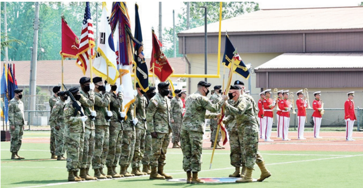
▲ 주한미군 지원사령관 취임식 : 마이클 빌스(앞줄 오른쪽) 미 8군사령관(육군 중장)이 지난 9일 대구 캠프워커 캘리언병장에서 열린 주한미군 제19지원사령관 취임식에서 스티븐 앨런(육군 준장) 신임 사령관에게 부대기를 건네고 있다.

트럼프 행정부가 한국의 방위비 양보를 압박하는 차원에서 주한미군 감축 카드를 내릴 경우 한·미 동맹에 적잖은 타격이 예상된다. 북한이 핵·미사일 역량을 지속해서 강화하는 가운데 한·미 동맹이 균열되고 있다는 대북 시그널은 물론 국내 여론 악화로 이어질 수 있기 때문이다.