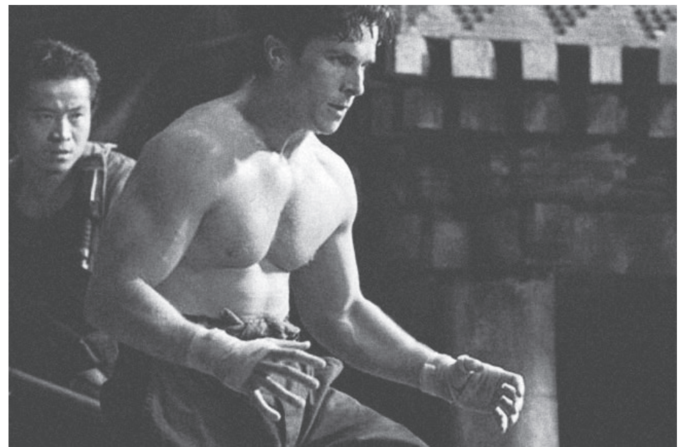
▲ 브래드 앤더슨 감독의 <머시니스트> (2004)