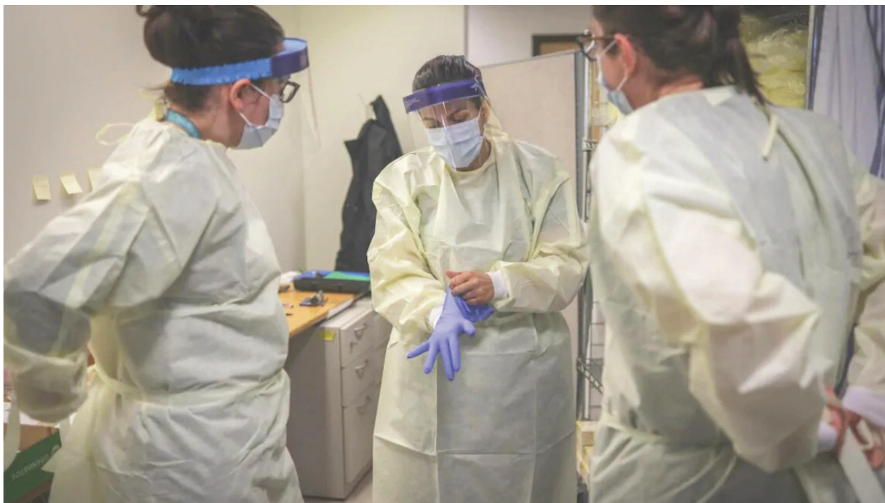
프스키 알버타 심장 연구소에 서도 환자 3명이 COVID-19 양성반응을 보였다.