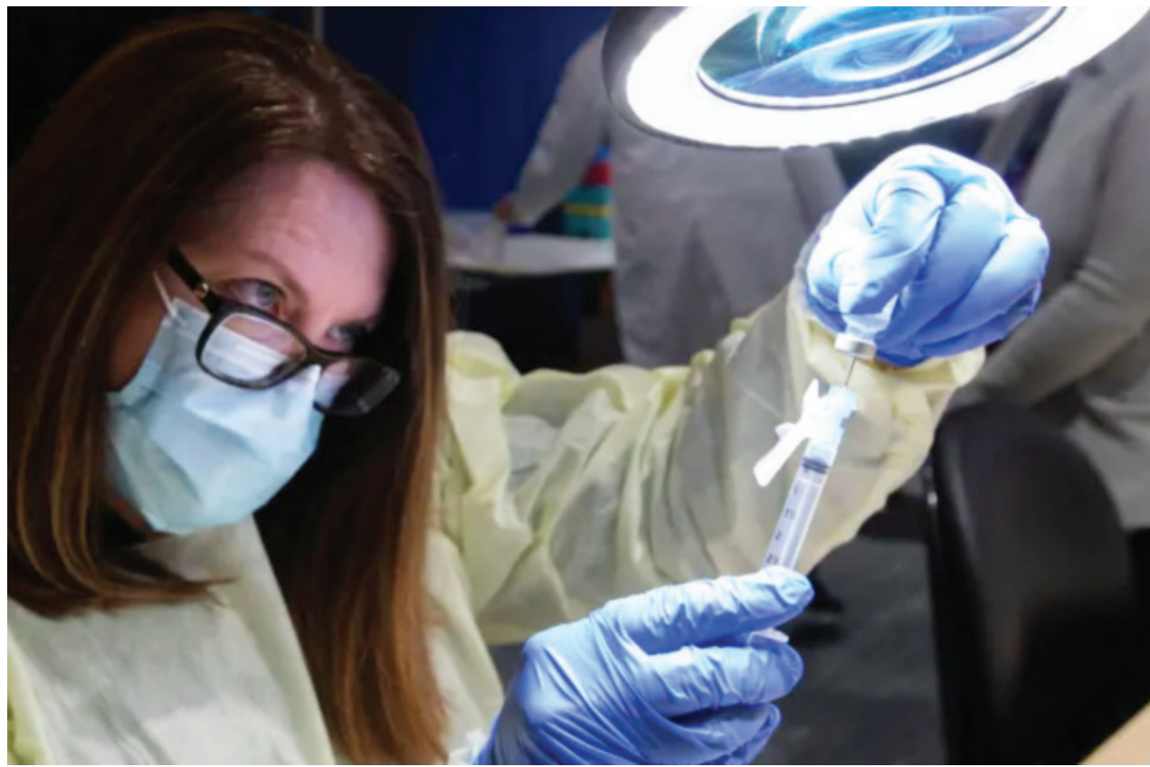
자들을 위한 약 1,500 명의 버타보건국은 모더나 백신 및 애드먼튼 지역의 계획된 접종 예약이 취소되었다. 알 의 부족으로 인해 남부 중부 2,000 건의 예방 접종이 완료